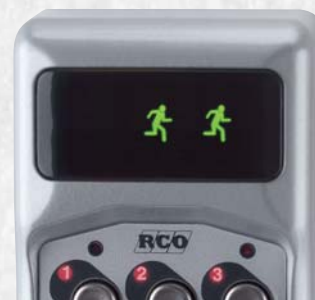
Växelvis indikering av gröna symboler för öppen dörr under dörröppningstiden.