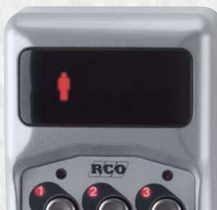
Röd symbol indikerar knapptryckning.